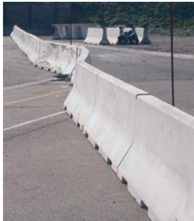
Bild 8: Mindestaufstelllänge: Typischer normgerechter „Bauch“ nach einem Fahrzeuganprall

Die in der „Initiative Betonschutzwand“ organisierten Hersteller von Betonschutzwandsystemen haben eine Systemübersicht ( www.initiative-betonschutzwand.de ) erstellt, die die einzelnen Systeme nach Aufhaltestufen von H1 bis H4b auflistet und den Planern somit eine Übersicht gibt, welcher Hersteller welches System in welchem Bereich anbietet. Bei allen aufgelisteten Systemen handelt es sich um Betonschutzwände, die nach DIN EN 1317 erfolgreich geprüft sind.