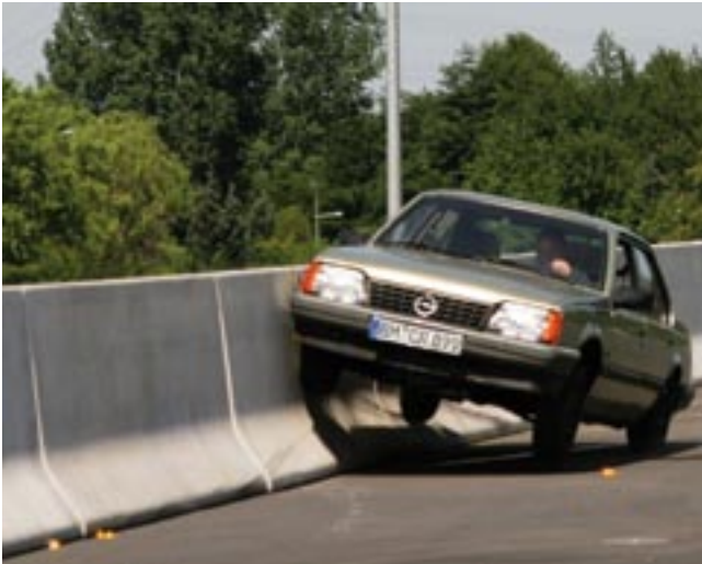
Bild 1: Betonschutzwände lenken aufprallende Fahrzeuge parallel zur Wand um und leiten sie an der Wand entlang

bruchrisikos für Lkw festzuhalten. Darüber hinaus dienen Betonschutzwände als Absturzsicherung an gefährlichen Stellen für Pkw und Lkw und gewährleisten darüber hinaus, dass eine Unterfahrung bei Motorradunfällen nicht möglich ist. Dadurch reduziert sich das Verletzungsrisiko bei diesen Unfällen. Aus rein fahrtechnischer Sicht bieten Betonschutzwände einen wirksamen Blendschutz, eine gute Leitfunktion und eine hohe Lichtreflexion. Durch einen vergleichsweise geringen Reparatur- und Unterhaltungsaufwand in Kombination mit einer hohen Lebensdauer sind Betonschutzwände in hohem Maße wirtschaftlich.