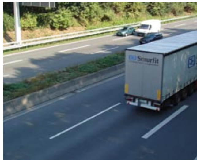
Bild 5: Mit Betonschutzwänden können Durchbrüche von schweren Fahrzeugen auf die Gegenfahrbahn sicher verhindert werden

Für die Klassifizierung der Umwelteinwirkungen stehen insgesamt sieben Expositionsklassen zur Verfügung, die jeweils in bis zu vier Stufen unterteilt werden. Unterschieden werden Einwirkungen auf den Beton selbst sowie auf die Bewehrung. Von den Expositionsklassen abgeleitet werden z. B. Mindestdruckfestigkeiten des Betons, Grenz-