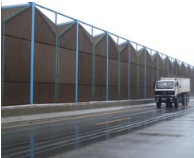
Bild 4: Geringe Wirkungsbereiche von Betonschutzwänden sichern z.B. dahinterstehende Lärmschutzwände vor Beschädigungen

Einsatz an öffentlichen Straßen vorgesehen sind, müssen nach DIN EN 1317 geprüft und zugelassen sein. Der Nachweis einer Aufhaltestufe erfolgt mit Pkw- und Lkw-Anfahrversuchen mit unterschiedlichen Fahrzeuggewichten, Geschwindigkeiten und Anprallwinkeln. In Deutschland werden nur die Aufhaltestufen T1, T2, T3, H1 und H2 in den künftigen Regelwerken verlangt. Andere Stufen werden in Sonderfällen gefordert, zum Beispiel H4b bei Anforderungen an sehr hohe Durchbruchssicherheit.