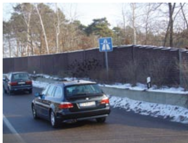
Bild 6: Betonschutzwände widerstehen dauerhaft Feuchte-, Frost-, Frost-Tausalz- und Chloridbeanspruchungen

In den letzten Jahren registriert man immer mehr Baustellen, auch von längerer Dauer und in großen Dimensionen (mehrere Kilometer lang) auf unseren Straßen, insbesondere auf Autobahnen. Bei ständig zunehmender Verkehrsdichte und einem weiter steigenden Schwerverkehranteil ergeben sich daraus auch Änderungen bezüglich der Anforderungen an die Sicherung von Baustellen. Der Schutz des Baustellenpersonals sowie der Verkehrsteilnehmer steht an erster Stelle. Jedoch sind auch die Aspekte Bauaufwand, Pflege und Dauerhaftigkeit zu be-