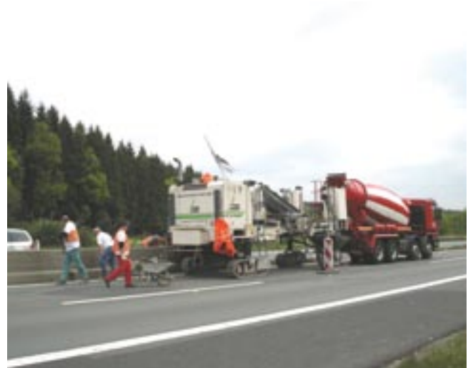
Bild 2: Präzise Fertigung einer Betonschutzwand vor Ort mit einem Gleitschalungsfertiger

bruchrisikos für Lkw festzuhalten. Darüber hinaus dienen Betonschutzwände als Absturzsicherung an gefährlichen Stellen für Pkw und Lkw und gewährleisten darüber hinaus, dass eine Unterfahrung bei Motorradunfällen nicht möglich ist. Dadurch reduziert sich das Verletzungsrisiko bei diesen Unfällen. Aus rein fahrtechnischer Sicht bieten Betonschutzwände einen wirksamen Blendschutz, eine gute Leitfunktion und eine hohe Lichtreflexion. Durch einen vergleichsweise geringen Reparatur- und Unterhaltungsaufwand in Kombination mit einer hohen Lebensdauer sind Betonschutzwände in hohem Maße wirtschaftlich.