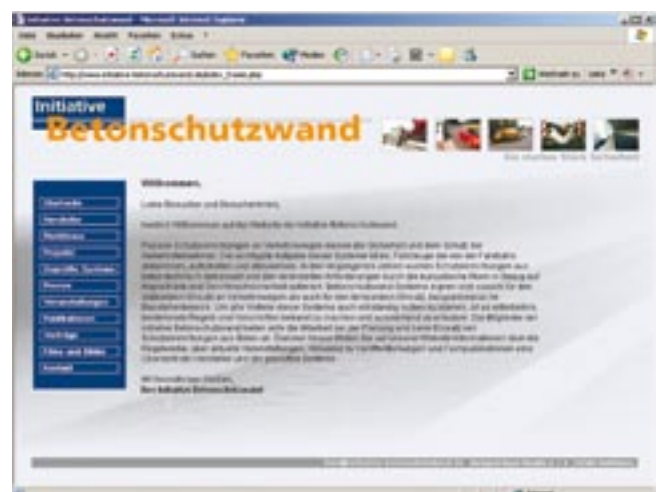
Bild 2: Interessenten finden auf der Website Informationen über Hersteller, Systeme, Richtlinien und aktuelle Veranstaltungen zum Thema Betonschutzwand