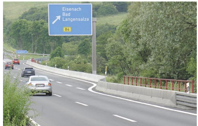
Bild 2: Betonschutzwände im Brückenrand- und Böschungsbereich auf der A4 bei Eisenach

Für die weiteren Anforderungen im Einsatzbereich Brücken und Stützwände, aber ebenfalls für die anderen Bereiche der kommenden RPS gibt es geprüfte, leistungsfähige Schutzsysteme aus Beton, die alle Belange der DIN 1317-2 erfüllen, Bild 2. (St)