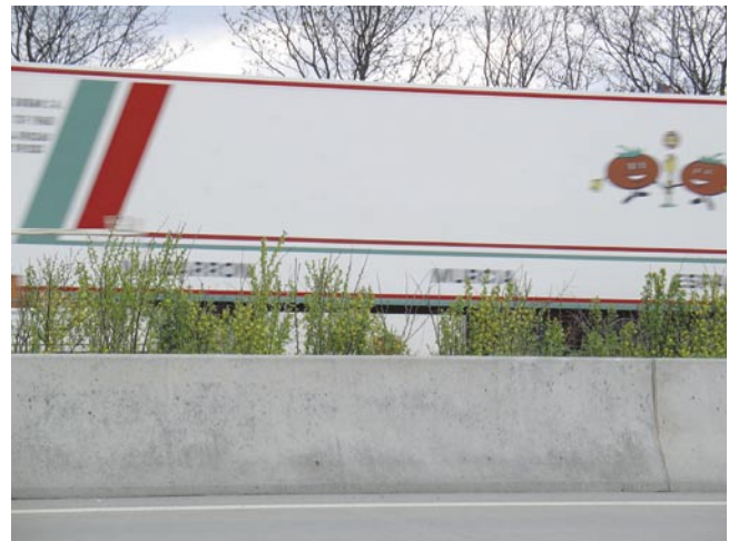
Bild 1: Hochbeete zwischen Betonschutzwänden ermöglichen in Wasserschutzgebieten sinnvolle und sichere Lösungen für den Mittelstreifen

In der engeren Schutzzone II erhalten die Bankette eine dichte Befestigung aus Asphalt oder Beton. Auf Dämmen müssen die Bankette mindestens 2,50 m breit ausgeführt werden. Die RiStWag schreibt auch hier nicht ausdrücklich eine bestimmte Art der Schutzeinrichtung vor. Aus den bereits oben genannten Gründen können aber auch hier nur Betonschutzwände in Frage kommen. Die Mittelstreifen in der engeren Schutzzone II erhalten die Bankette eine abdichtende Asphalt- oder Betonbefestigung. Hier kann wiederum auf die teure Befestigung verzichtet werden, wenn Schutzwände der Aufhaltestufe