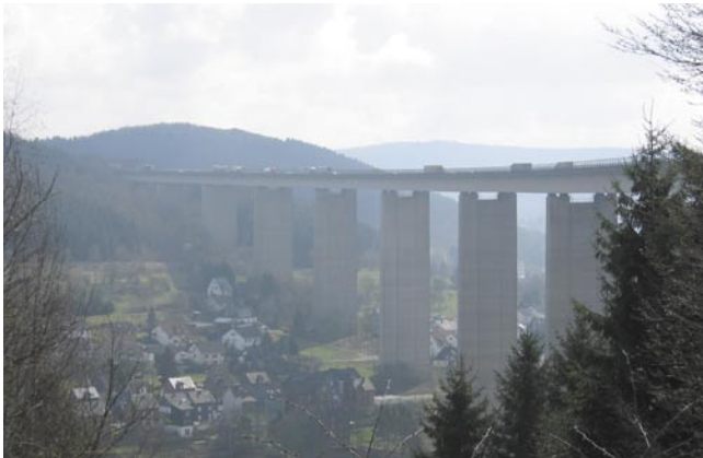
Bild 1: Die Brückenränder der Siegtalbrücke wurden mit Betonfertigteilsystemen der Aufhaltestufe H4b geschützt

Auf der A 45 wurden 2003 und 2004 die Siegtalbrücke und die Blechetalbrücke mit einem Betonfertigteilsystem