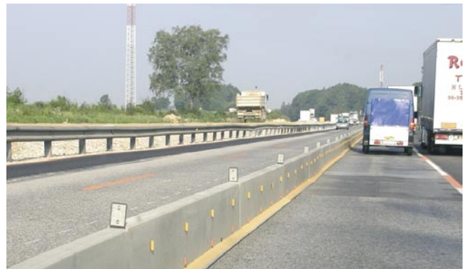
Bild 2: Einsatzbereiche für transportable Schutzeinrichtungen auf zweibahnigen Straßen (nach ZTV-SA 97)

Eine Übersicht von geprüften Fahrzeug-Rückhaltesystemen aus Beton für den temporären Einsatzbereich befindet sich auf S. 6/7 des Infobriefes. (St)